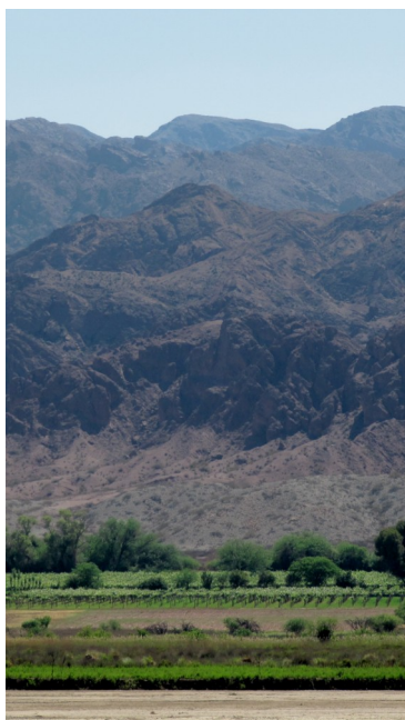
Foto: elk dorp heeft z'n eigen "hoogste wijngaarden van Argentinië". Dit is er zo eentje.